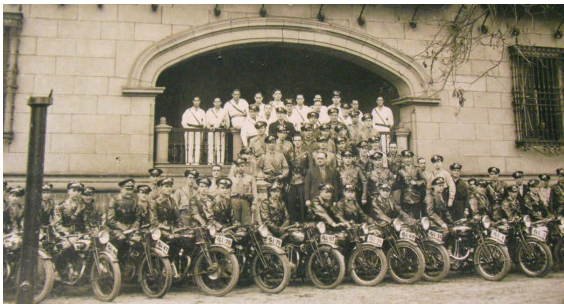
Ertzaña Igiletua 1937an.